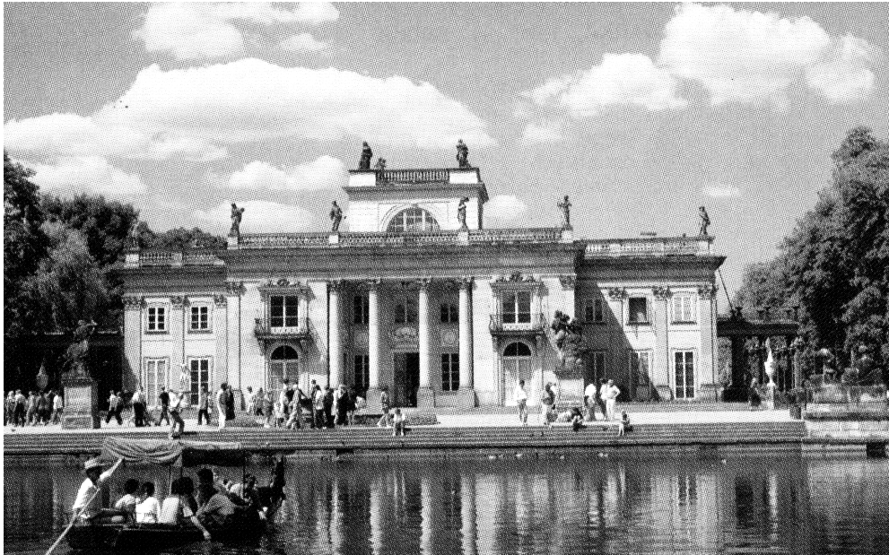
Łazienki Królewskie, pałac Na Wodzie, [w:] Nowa encyklopedia powszechna PWN, Warszawa 1998.

Na podstawie ilustracji oceń, czy zdania są prawdziwe. Zaznacz TAK lub NIE.