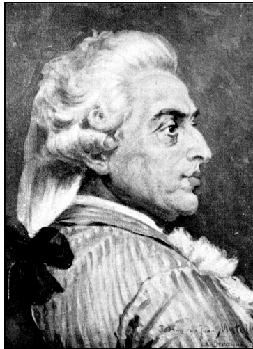
Stanisław August Poniatowski 1732–1798

Jan Matejko, Poczet królów i książąt polskich , Warszawa 1996.