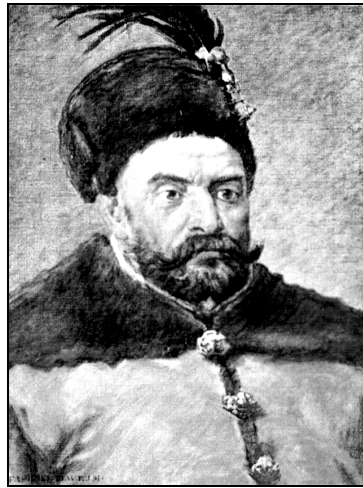
Stefan Batory 1533–1586