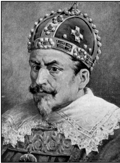
Zygmunt III Waza 1566–1632