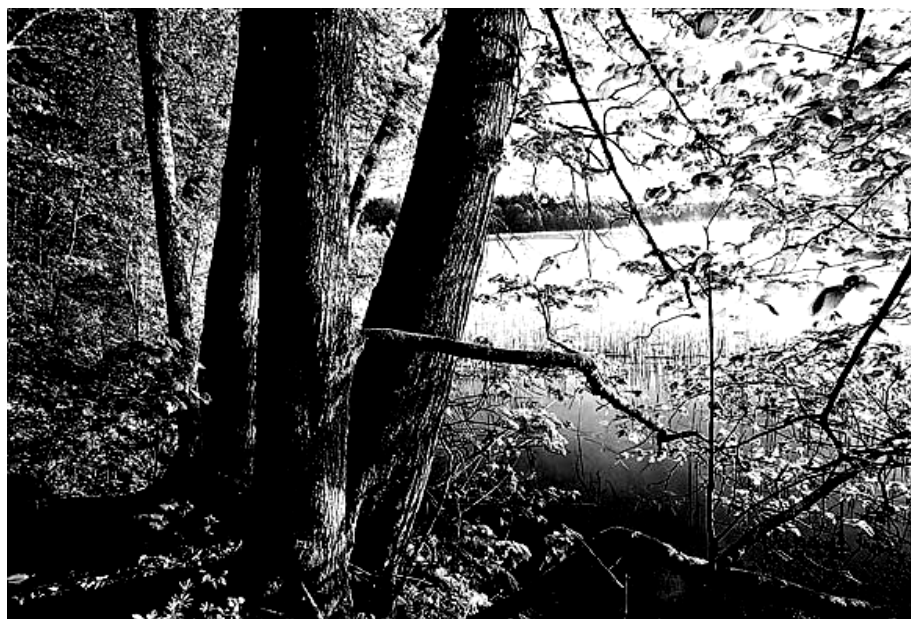
fot. P. Fabijański, ... jezioro Pilwąg, [w:] Encyklopedia PWN Portal , Warszawa 2003.

Przyjrzyj się ilustracji i wykonaj zadania 6. i 7.