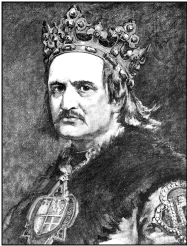
Władysław II Jagiełło 1348–1434

Na podstawie ilustracji i ich podpisów wykonaj zadania 19. i 20.